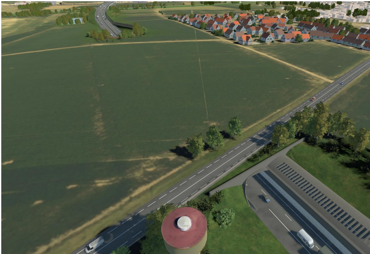
Vue de synthèse de la section couverte de l'A355 et de la route métropolitaine RM226 qui enjambe l'ouvrage.