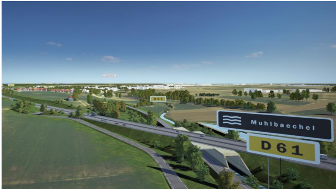
Vue de synthèse de l'ouvrage de franchissement du COS et du rétablissement définitif de la RM61 à gauche et du Muhlbachel à droite.