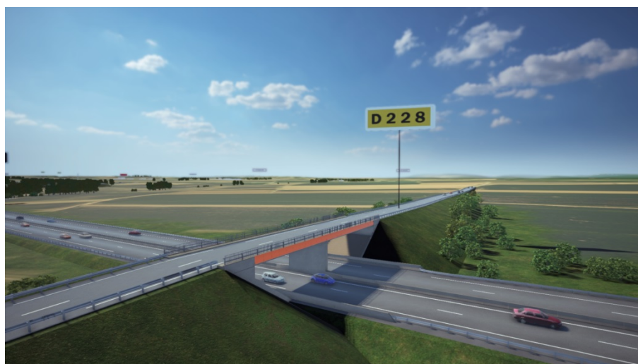
RD228 Entre Hurtigheim et la RN4-Vue de synthèse