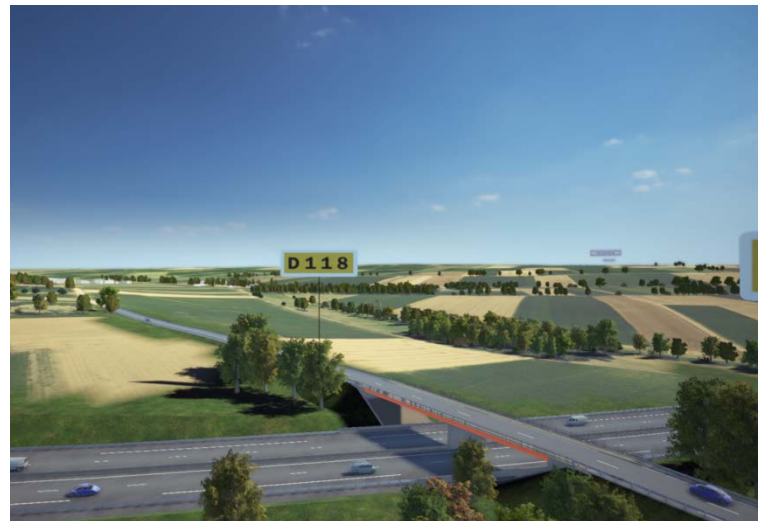
Vue de synthèse de la RM/118 et de l'ouvrage de franchissement