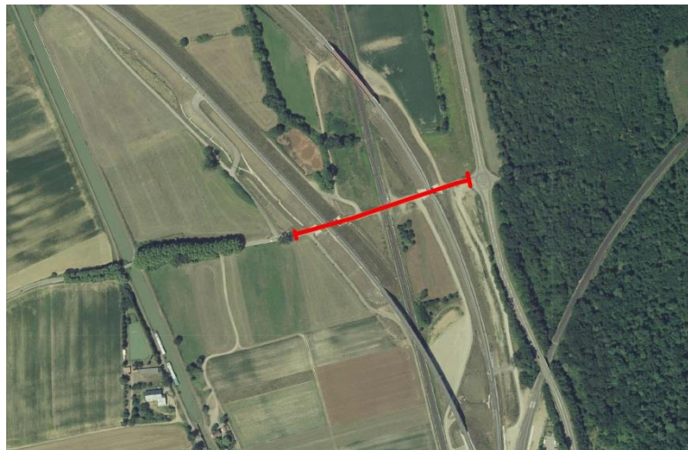
Trait rouge : section de la route de Hoerdt totalement fermée à la circulation