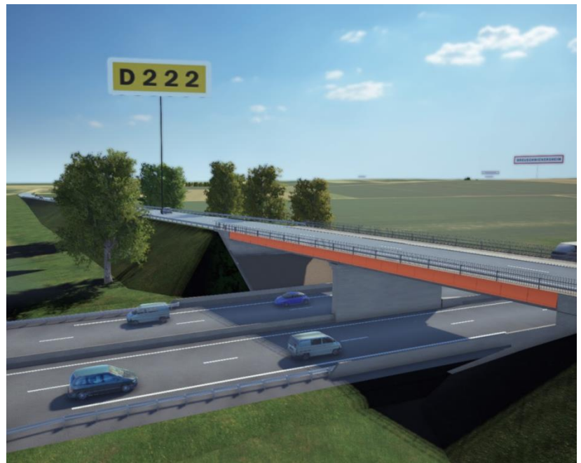
Vue de synthèse de la RD222 et de l'ouvrage de franchissement