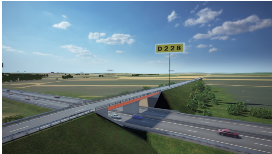
RD228 entre Hurligheim et la RN4 – Vue de synthèse